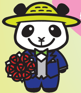
JAバンクえひめキャラクター ばんじゃくん